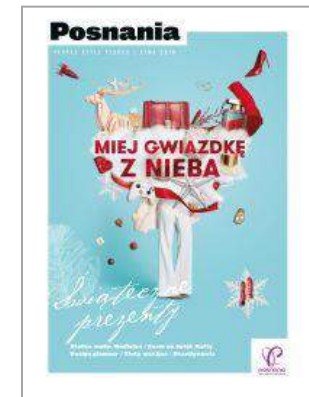
Posnania - "Posnania" - Apsys Polska S.A.