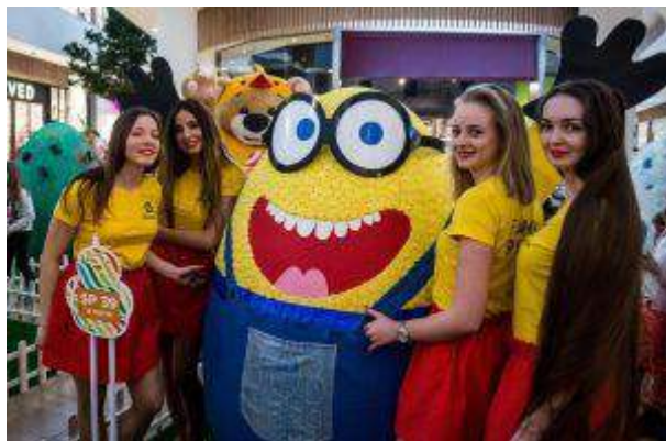
Centrum Riviera - "Fabryka Pisanek" - Mayland Real Estate Sp. z o.o.