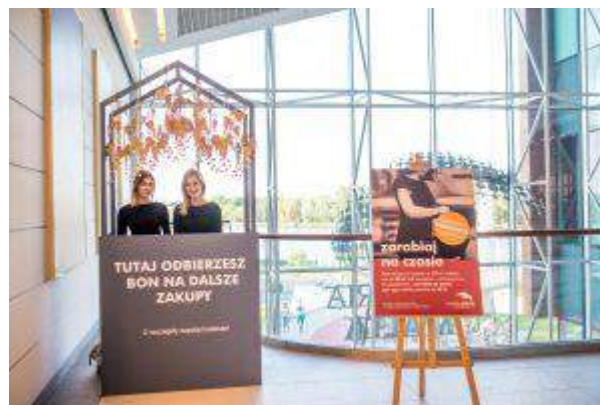
Galeria Malta - "Oddajemy 1 000 000 klientom" - NEINVER Polska Sp. z o.o.