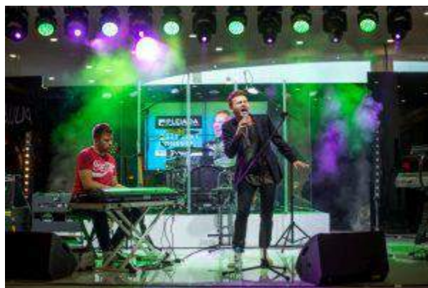
CH Plejada Sosnowiec - "Muzyczny Konkurs z Janowskim" - Cushman & Wakefield Polska Sp. z o.o.