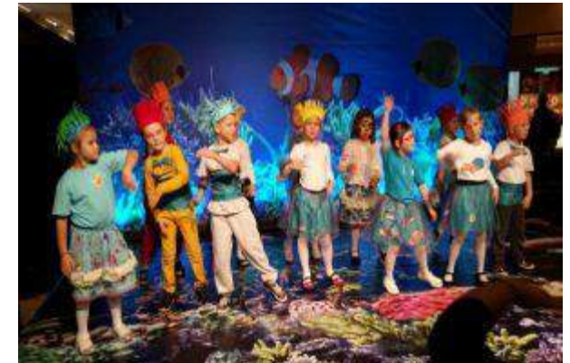
Galeria Jurajska - "JuRajska Wyspa" - Globe Trade Centre S.A.