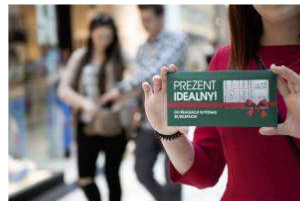
CH Sarni Stok - "Bonus na kartę" - Cushman & Wakefield Polska Sp. z o.o.