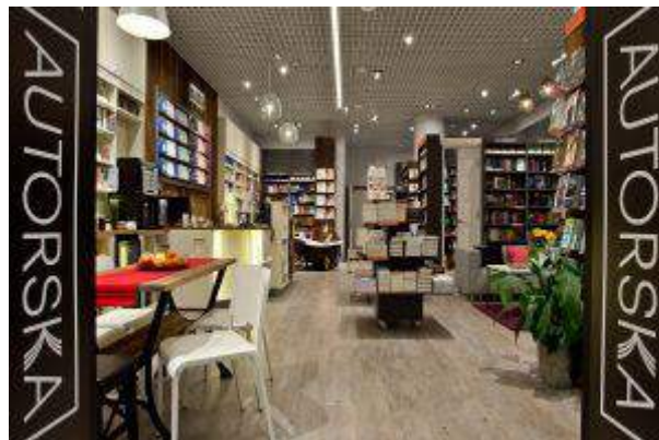
Księgarnia AUTORSKA - Społeczny Instytut Wydawniczy Znak Sp. z o.o. Pierwszy sklep w Polsce: 08.05.2015 Ilość sklepów w Polsce: 6