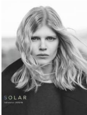
SOLAR - "Kampania fall/ winter 2015/16" - Solar Company S.A.