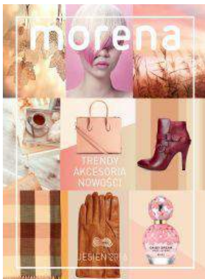
Galeria Morena - "Morena" - Carrefour Polska Sp. z o.o.