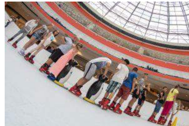
Galeria Wisła - "Wakacje na lodowisku" - CREAM Sp. z o.o.