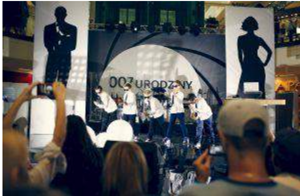
Galeria Jurajska - "007 Urodziny" - Globe Trade Centre S.A.