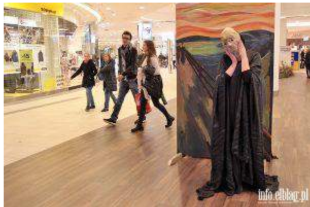
CH Ogrody - "Noc Wyprzedaży z Pokazem Żywych Obrazów" - CPI Poland Sp. z o.o.