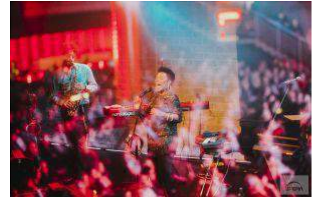
CH Sfera - "Zadymka Jazzowa" - CBRE Global Investors Poland Sp. z o.o.