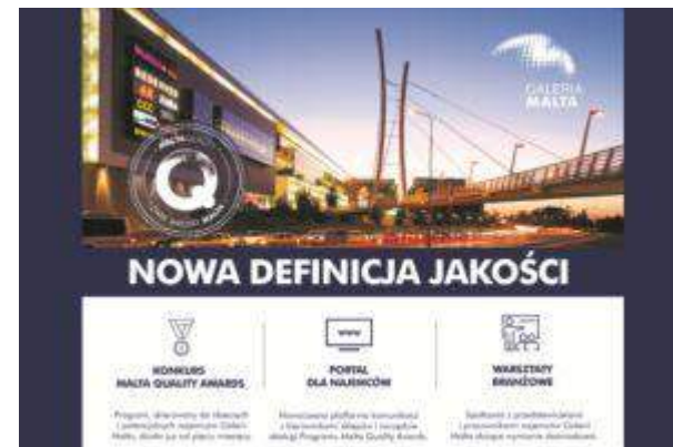
Galeria Malta - "Malta Quality Awards" - NEINVER Polska Sp. z o.o.