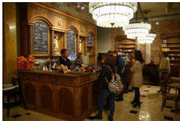
Green Caffè Nero - Green Coffee Sp. z o.o. Pierwszy sklep w Polsce: 10.01.2003 Ilość sklepów w Polsce: 55