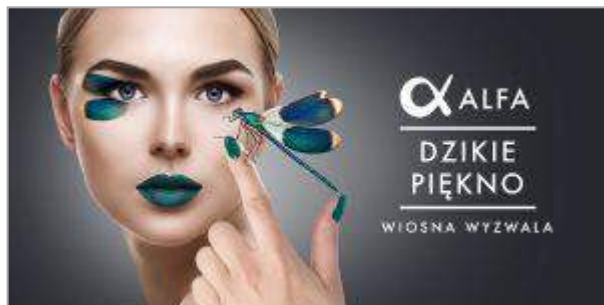
Alfa Centrum Białystok - „Piekno natury- Piękno człowieka” - A-JWK Management Sp. z o.o. Sp. J.