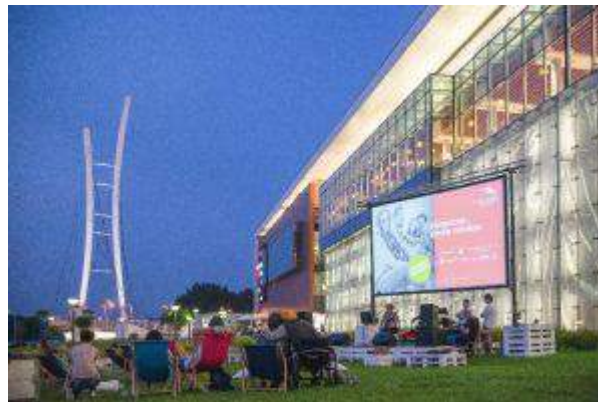
Galeria Malta - "Projekt Weekend" - NEINVER Polska Sp. z o.o.