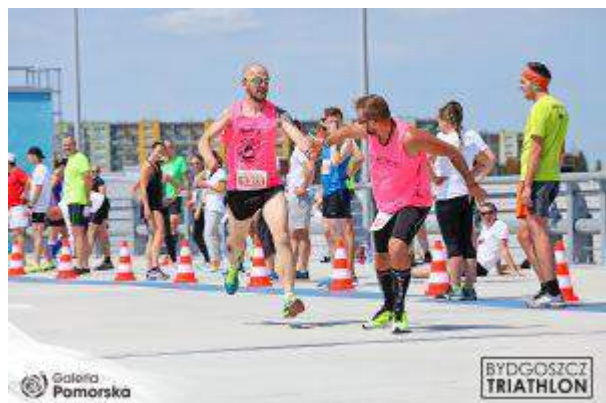
Galeria Pomorska - "Bieg sztafetowy z Bydgoszcz Triathlon" - Pomorska Investments Sp z o.o.