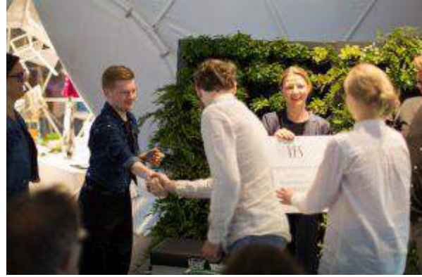
YES Biżuteria - "Program Stypendialny YES" - YES Biżuteria Sp. z o.o.