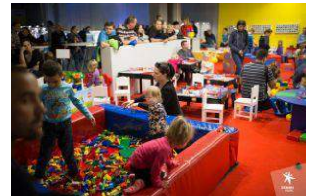
Gemini Park Bielsko-Biała - "Wystawa budowli z klocków LEGO" - Gemini Park Sp. z o.o.