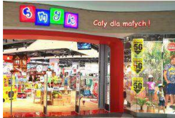
SMYK - Cały dla małych! - Smyk All For Kids S.A. Pierwszy sklep w Polsce: 01.04.2000 Ilość sklepów w Polsce: 232