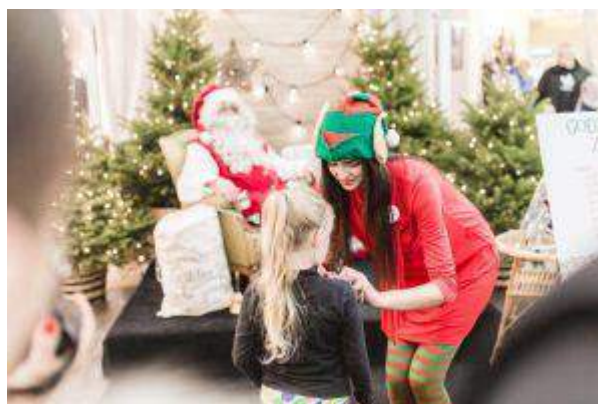
CH Ferio - "Zdjęcie z Mikołajem - Pamiątka na lata" - Cushman & Wakefield Polska Sp. z o.o.