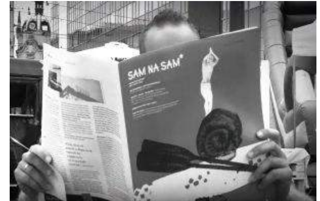
DH Supersam - „Sam na Sam” Magazyn Miejski - EPP Property Management - Grupa EPP Sp. z o.o. Sp.K.