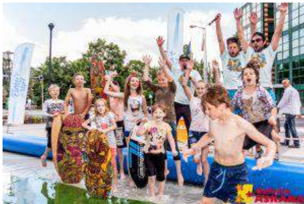
Galeria Askana - "Festiwal sportów ekstremalnych" - CREAM Sp. z o.o.