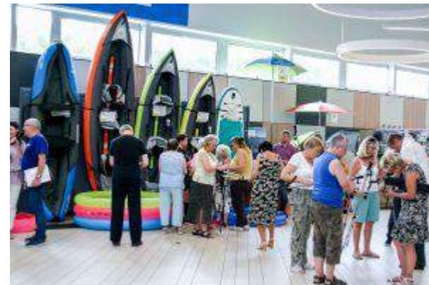
CH Auchan Katowice - "Zdrowy i aktywny Senior" - Immochan Polska Sp. z o.o