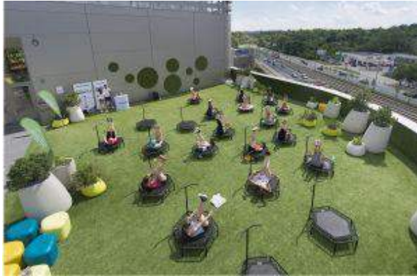
Galeria Morena - "Taras. pełen energii" - Carrefour Polska Sp.z o.o.