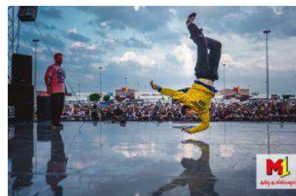
Sieć CH M1 : M1 Czeladź, M1 Częstochowa, M1 Kraków, M1 Łódź, M1 Poznań, M1 Radom, M1 Zabrze, M1 Marki, M1 Bytom - "Dance Battle" - METRO Properties Sp. z o.o.