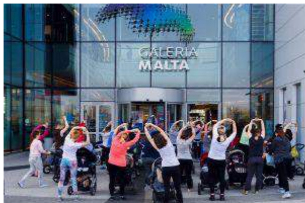
Galeria Malta - "Be Fit Mom" - NEINVER Polska Sp. z o.o.