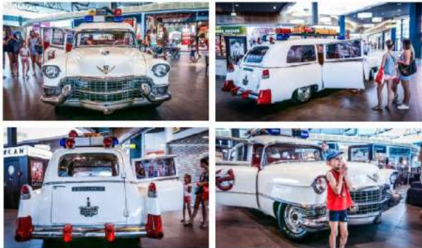
CH Jantar - "Wystawa Pojazdów Filmowych" - CBRE Global Investors Poland Sp. z o.o.