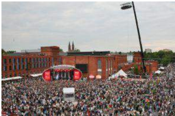
Manufaktura - "10 Urodziny Manufaktury" - Apsys Management Sp. z o.o.