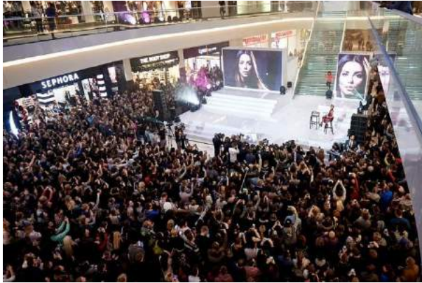
Posnania - "Posnania Grand Opening" – Apsys Management sp. z o.o.