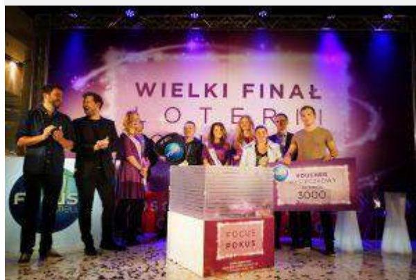
Focus Bydgoszcz - "FOCUS Pokus" - Atrium Poland Real Estate Management Sp. z o.o.