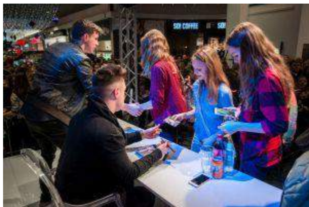
Atrium Biała - "Youtuberzy na żywo" - Atrium Poland Real Estate Management Sp. z o.o.