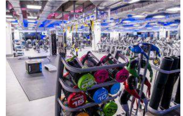
CityFit - CityFit Sp. z o.o. Pierwszy sklep w Polsce: 21.07.2014 Ilość klubów w Polsce: 10