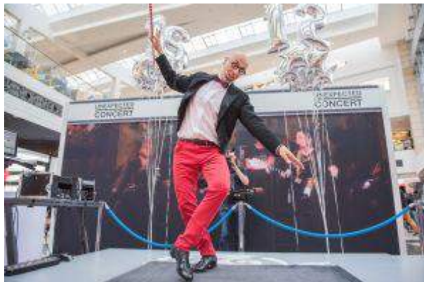
CH Arkadia - "Unexpected concert" - Unibail- Rodamco Polska Sp. z o.o.