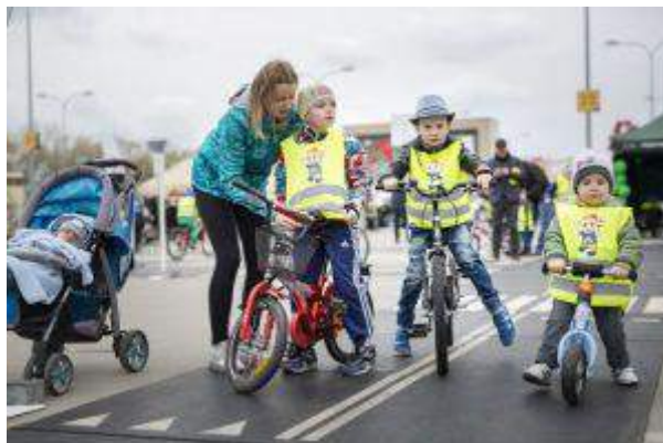
Atrium Felicity - "Piknik na Dwóch Kótkach" - Atrium Poland Real Estate Management Sp. z o.o.