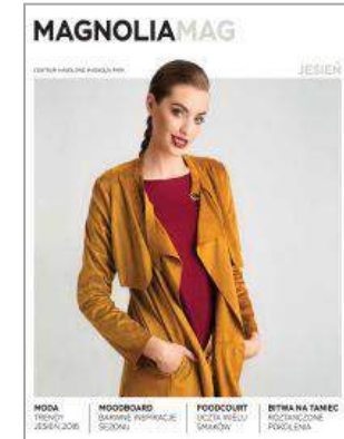
Magnolia Park - "Magnolia Mag" - Multi Poland