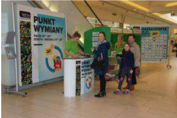
Galeria Bronowice - "Zmień - Wymień - Podaruj" - Immochan Polska Sp. z o.o.