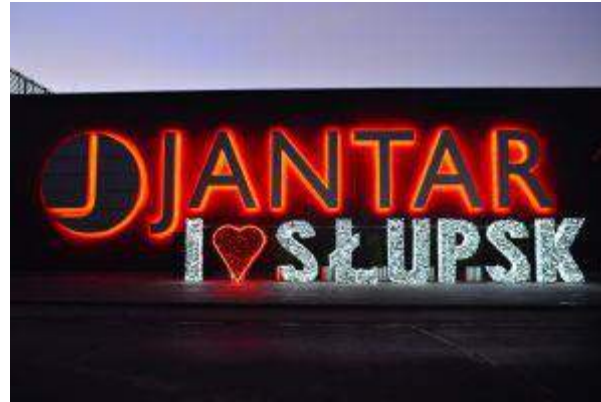
CH Jantar - "Inauguracja napisu I LOVE SŁUPSK" - CBRE Global Investors Poland Sp. z o.o.