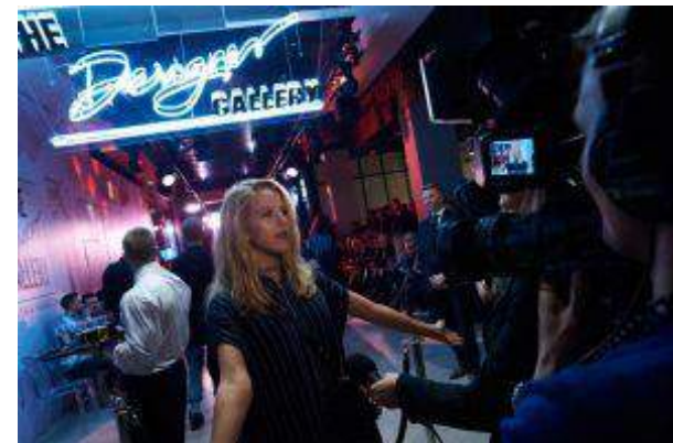
Galeria Mokotów - "Otwarcie strefy The Designer Gallery" - Unibail Rodamco sp. z o.o.