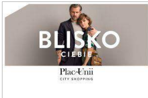
Plac Unii City Shopping - "Miejsce Korzyści" - We Care Proptert Management