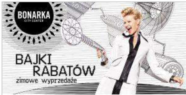
Bonarka City Center - "Wehikuł Kultury" - Bonarka City Center Sp. z o.o.