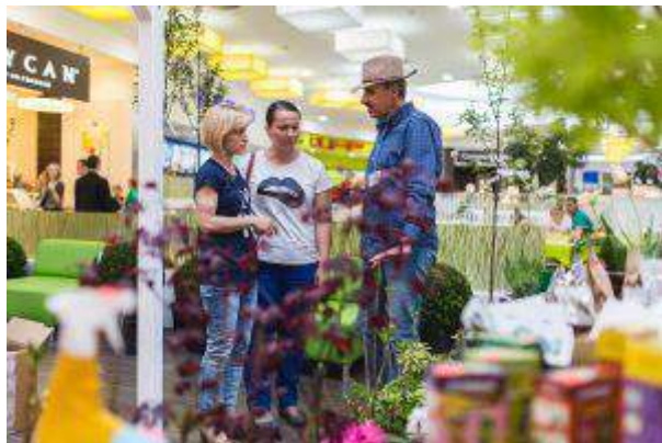
CH Ferio - "Miej Maj w Ogrodzie" - Cushman & Wakefield Polska Sp. z o.o.