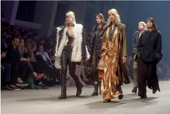
KAZAR - "Premiera Kolekcji Jesień/Zima" - Kazar Footwear Sp. z o.o.