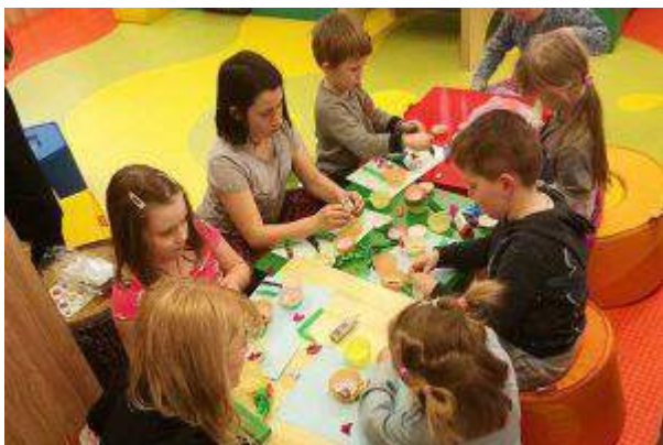
CH Auchan Łomianki - "Piątki z angielskim za free!" - Immochan Polska Sp. z o.o.