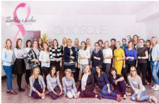
QUIOSQUE - "Zadbaj o siebie. Modna, piękna i zdrowa" - PBH S.A.