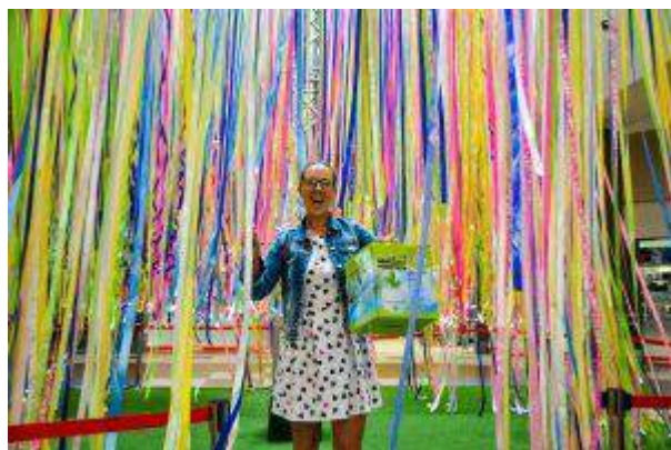
CH Platan, CH Bielawy, CH Osowa, CH Czyżyny - "Loteria Wstążkowa zrealizowana w 5 centrach handlowych" - Apsys Polska S.A.