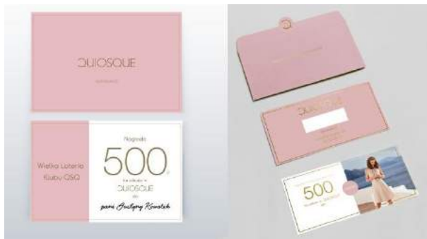
QUIOSQUE - "Klub QSQ" - PBH S.A.