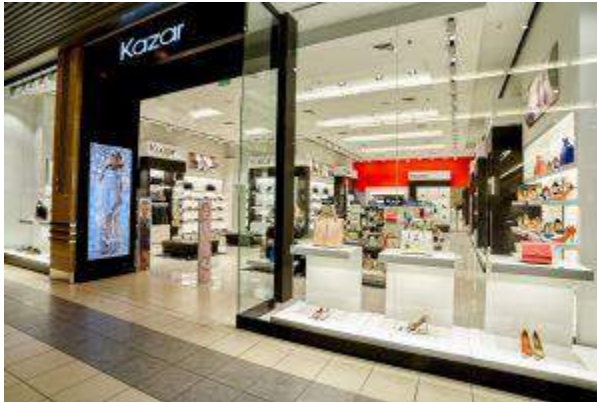
Kazar - Kazar Footwear Sp. z o.o. Pierwszy sklep w Polsce: 01.12.1996 Ilość sklepów w Polsce: 58