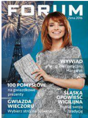
CH FORUM - "Magazyn "Forum" - CH FORUM Gliwice