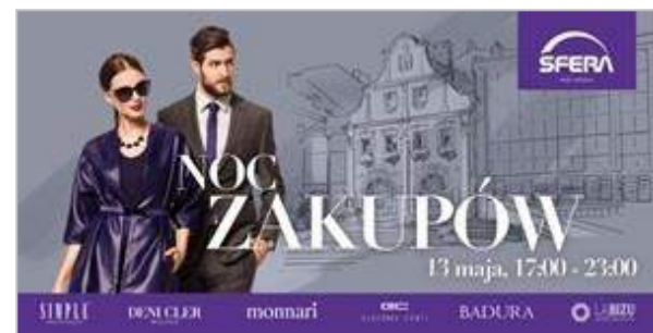
Galeria Sfera - "Sfera - Moje Miejsce" - CBRE Global Investors Poland Sp. z o.o.