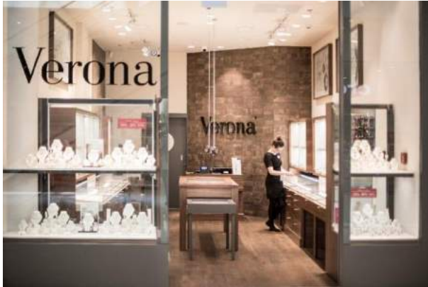
Verona - YES Biżuteria Sp. z o.o. Pierwszy sklep w Polsce: 30.04.2015 Ilość sklepów w Polsce: 11 (Franczyza)