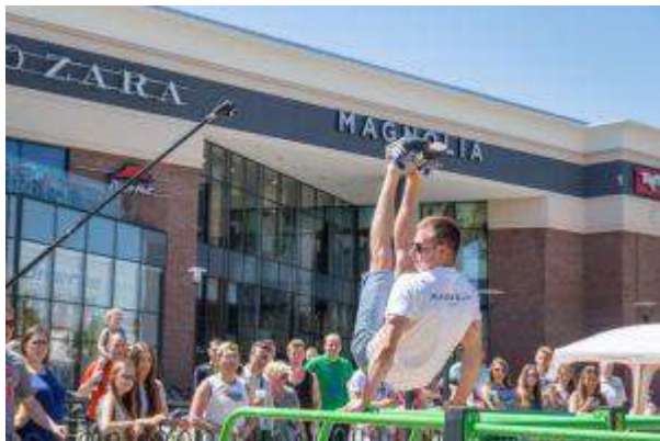
Magnolia Park - "Magnolia Sport" - Multi Poland