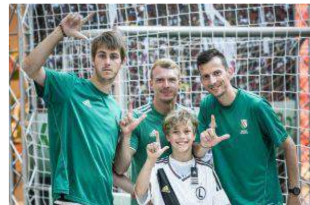
Atrium Targówek - "Wielkie Emocje Małych Piłkarzy" - Atrium Poland Real Estate Management Sp. z o.o.