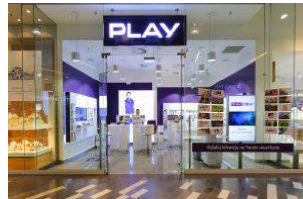
PLAY - P4 Spółka z o.o. Pierwszy sklep w Polsce: 15.03.2007 Ilość sklepów w Polsce: 897