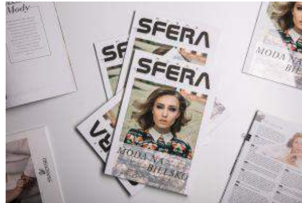
Galeria Sfera - "Modna Sfera" - CBRE Global Investors Poland Sp. z o.o.