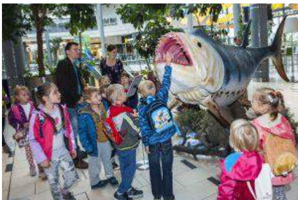
CH Forum - "Morskie Giganty" - CH FORUM Gliwice