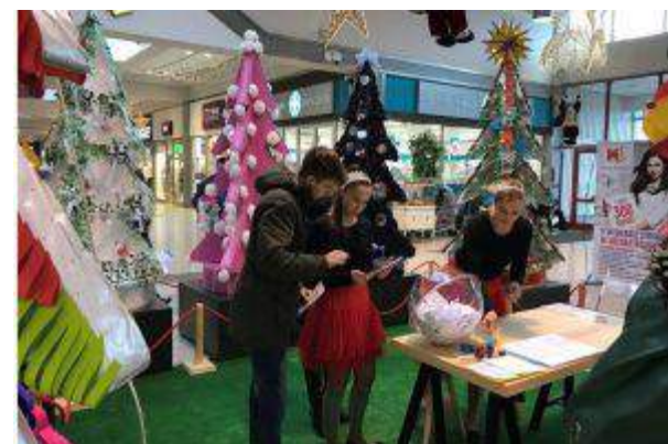
Sieć CH M1 : M1 Czeladź, M1 Częstochowa, M1 Kraków, M1 Łódź, M1 Poznań, M1 Radom, M1 Zabrze, M1 Marki, M1 Bytom - "Rozdajemy Choinki" - METRO Properties Sp. z o.o.