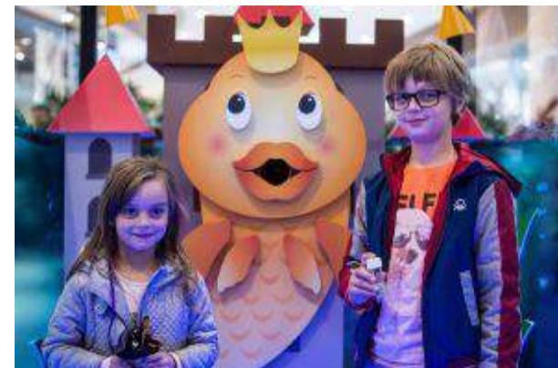
Centrum Riviera - "3 MAMY SIĘ ŚWIETNIE" - Mayland Real Estate Sp. z o.o.