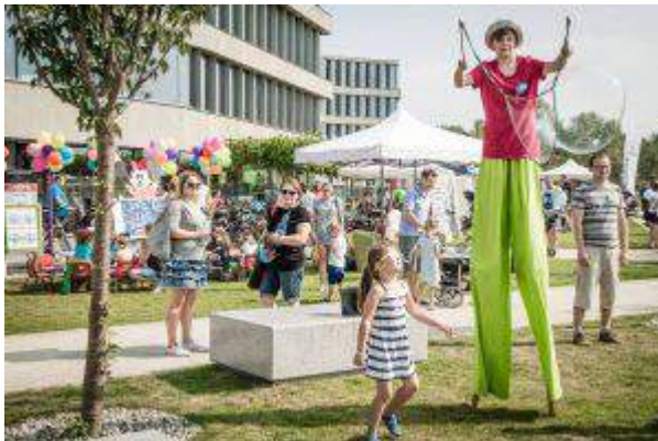
Royal Wilanów - "Royal Wilanów na rzecz lokalnej społeczności" - Capital Park S.A.