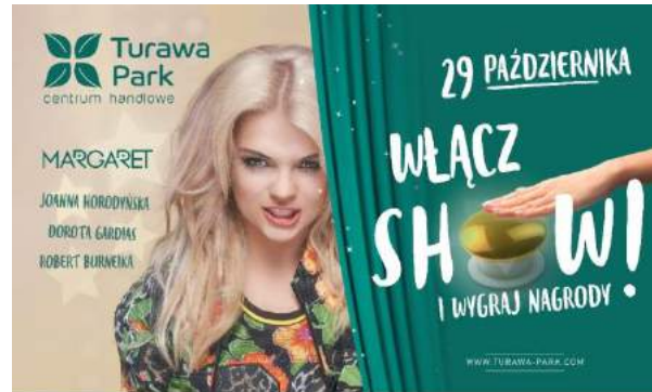
CH Turawa Park - "WŁĄCZ SHOW!" - Turawa Park Sp. z o.o.