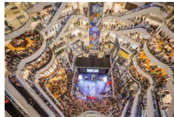
Blue City - "Black City" - Blue City Sp. z o.o.