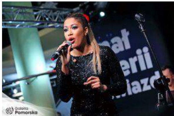
Galeria Pomorska - "Świąteczna Loteria z Gwiazdami" - Pomorska Investments Sp z o.o.