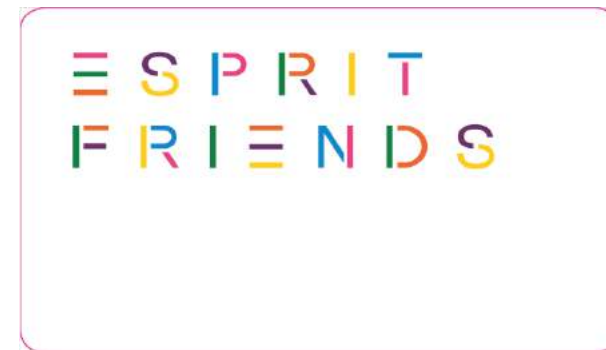
Esprit - "Esprit Friends" - Esprit Poland Retail Sp. z o.o.