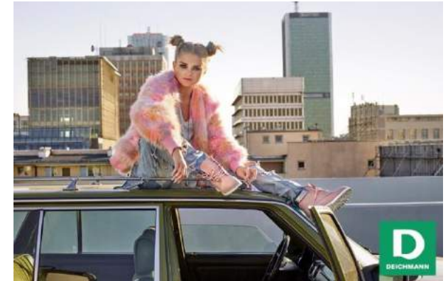
Deichmann - "Deichmann x Margaret" - Deichmann-Obuwie Sp. z o.o.