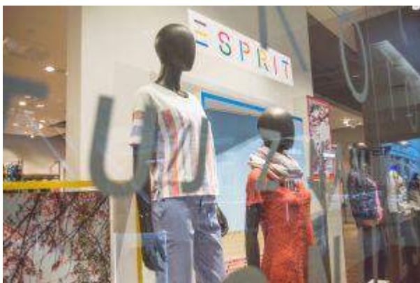
Esprit - Esprit Poland Retail Sp. z o.o. Pierwszy sklep w Polsce: 17.05.2006 Ilość sklepów w Polsce: 11