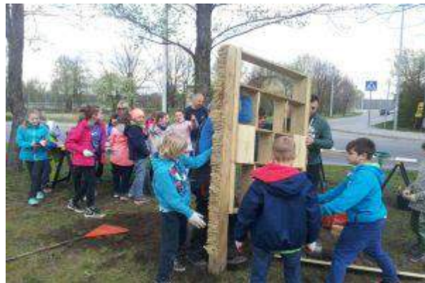
CH Auchan Łomianki - "Zbuduj z nami oazę dla zwierząt" - Immochan Polska Sp. z o.o.