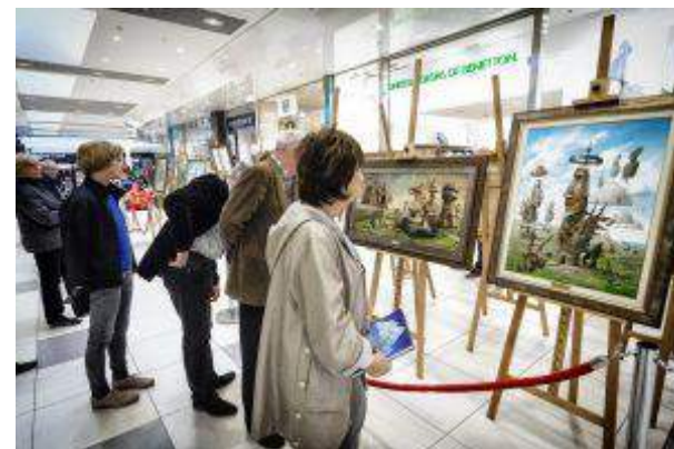
3 Stawy - "Noc Muzeów" - Apsys Polska S.A.