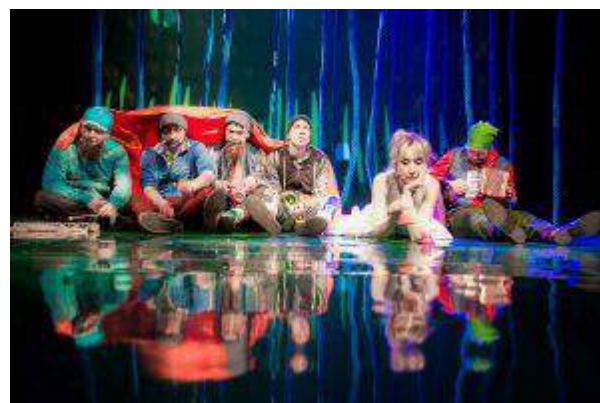
Galeria Kazimierz - "Krasnoludki są na świecie" - Invesco Real Estate