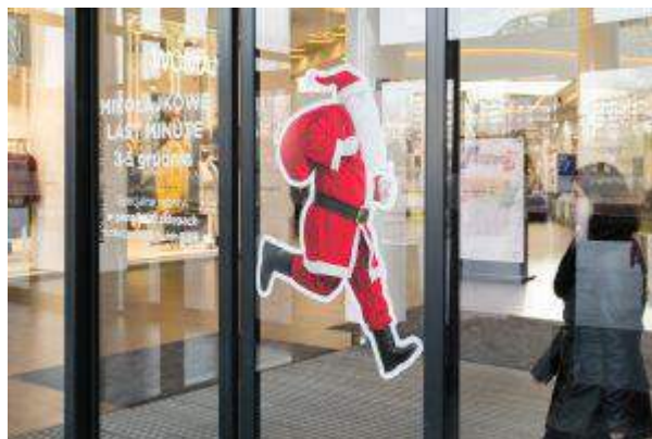
Magnolia Park - "Mikołajkowe Last Minute" - Multi Poland