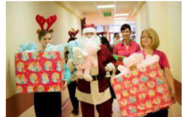
Galeria Malta - "Podziel się świąteczną atmosferą. Wyprawa do wioski Świętego Mikołaja" - NEINVER Polska Sp. z o.o.