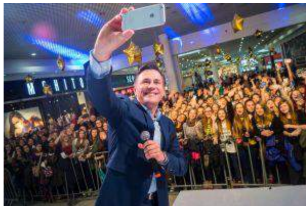
CH Plejada Sosnowiec - "Plejada Gwiazd" - Cushman&Wakefield Polska Sp. z o.o.