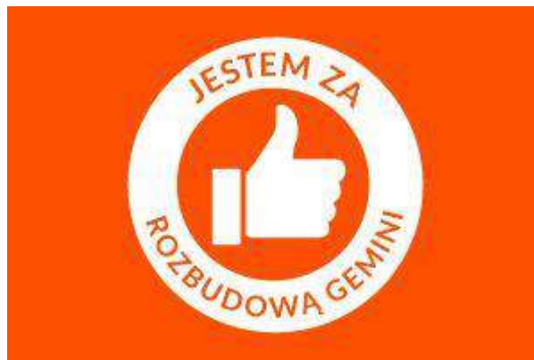
Gemini Park Tarnów - "Jestem ZA rozbudową" - Gemini Jasna Park SP. z o.o.