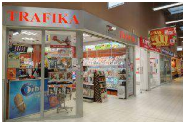
TRAFIKA - Tabak Polska Sp. z o.o. Pierwszy sklep w Polsce: 24.11.2001 Ilość sklepów w Polsce: 159