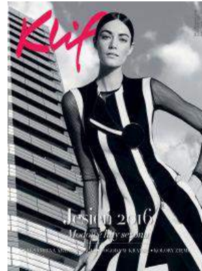
DM Klif w Warszawie oraz CH Klif w Gdyni - "Magazyn Mody Klif" - Paige Investments Sp. z o.o.