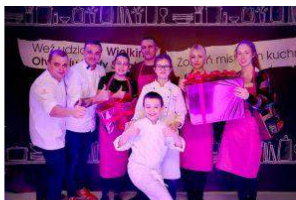
Aura Centrum Olsztyna - "Wielkie otwarcie Strefy Smaku." - Balmain Property Management Sp. z o.o.