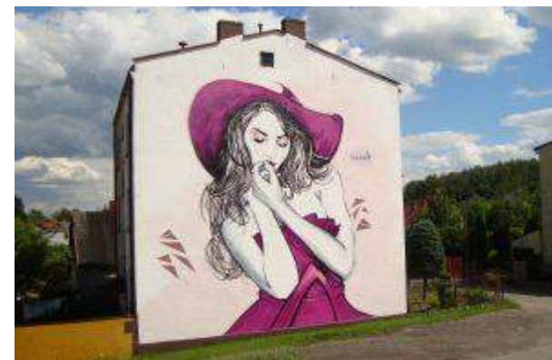
Centrum Galardia - "My dajemy tylko pretestk... - murale w Starachowicach" - BSC Property Management Sp. Z .o.o. Spółka Komandytowa