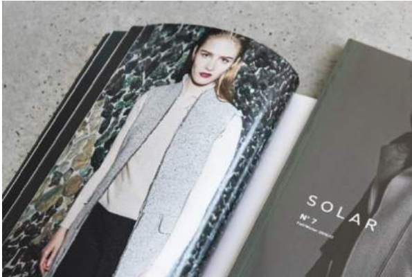
SOLAR - "SOLAR MAGAZYN" - Solar Company S.A.