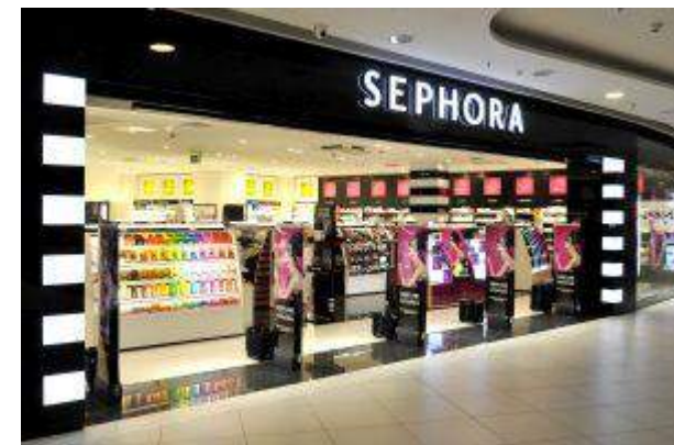
Sephora - Sephora Polska Sp. z o.o. Pierwszy sklep w Polsce: 07.10.1999 Ilość sklepów w Polsce: 95