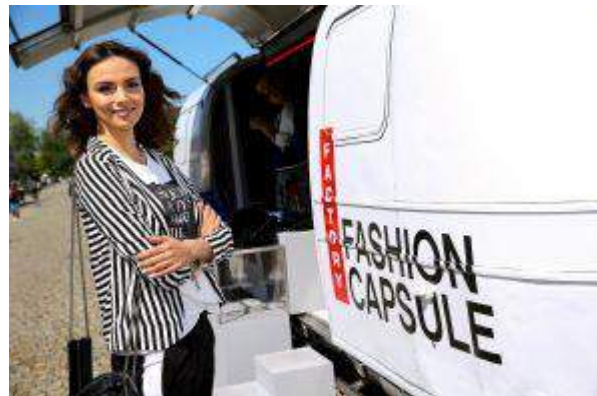
Factory Anapol, Factory Ursus, Factory, Kraków, Factory Poznań - "Factory Fashion Capsule" - NEINVER Polska Sp. z o.o.