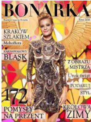
Bonarka City Center - "BONARKA" - Bonarka City Center Sp. z o.o.