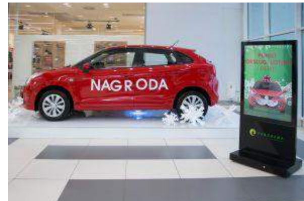
CH Panorama - "Wygraj auto w świątecznej loterii!" - BSC Property Management Sp. Z .o.o. Spółka Komandytowa