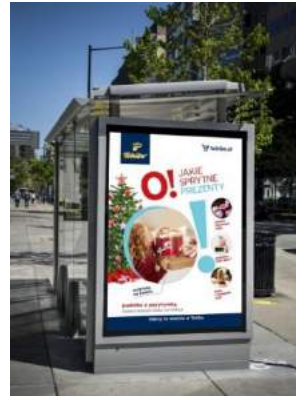
Tchibo - "O! Jakie spytne!" - Tchibo Warszawa Sp. z o.o.