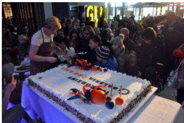
Galeria Orkana - "10 urodziny Galerii Orkana" - Cushman & Wakefield Polska Sp. z o.o.