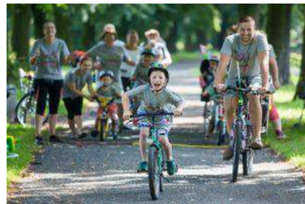
Europa Centralna - "Jeżdżę i Pomagam" - Apsys Polska S.A.