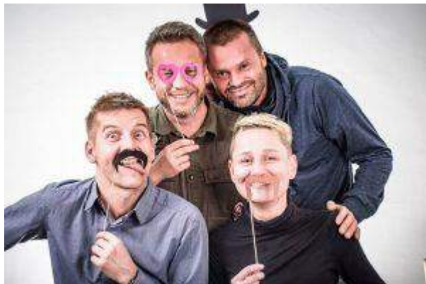
Galeria Bronowice - "Męskie sprawy - Kampania Movember" - IMMOCHAN POLSKA Sp. z o.o.