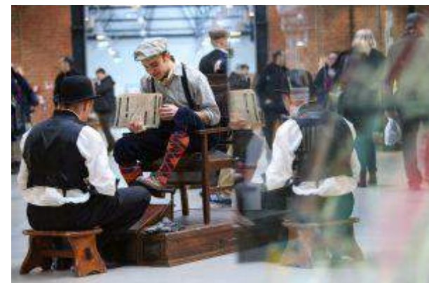
Ferio Wawer - "Przeżyjmy to jeszcze raz! Event retro w Ferio Wawer" - BHK Kraków Joint Venture Sp. z o.o.