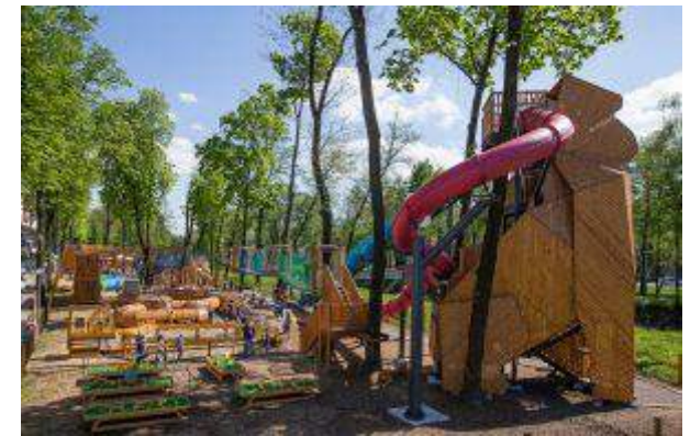
Gemini Park Bielsko-Biała - "EkoPark W DECHE! - włącz zabawę" - Gemini Park Sp. z o.o.