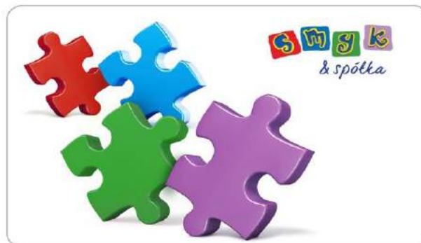
SMYK - Cały dla małych! - "Program lojalnościowy »SMYK & spółka«" - SMYK S.A.