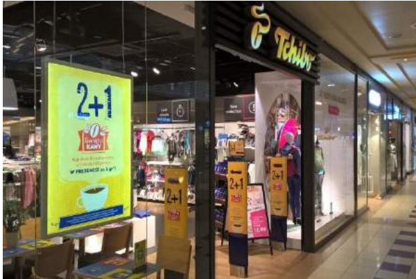
Tchibo - "Święto Kawy 2+1" - TCHIBO Warszawa Sp. z o.o.