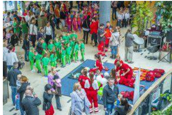
CH Forum - "Pozytywnie z Pozytywnymi" - Centrum Handlowe FORUM Gliwice