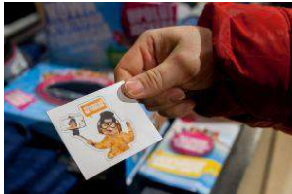
Aura Centrum Olsztyna, Galeria Handlowa Panorama, Centrum Galardia - "Dowiedz się co myślą zwierzaki!" - BSC Property Management Sp. Z .o.o. Spółka Komandytowa